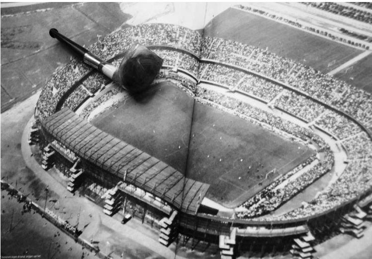
Afb. 5. De Feijenoord pijp met afbeelding van het stadion.

Niemand in Rotterdam of zelfs Nederland heeft ooit zo'n groot stadion gezien, en velen om hem heen hebben geloven niet dat zo'n groot stadion ooit vol komt.