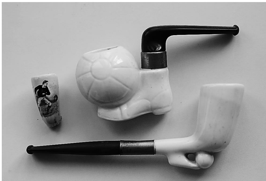
Afb. 4. Drie Nederlandse gietpijpen met thema Voetbal. De afbeelding op het pijpje linksboven is middels een 'transfer' aangebracht. Gouda, ca 1910-1950.

Ook populair was het model waarbij een onderbeen met voetbal schoen een voetbal onder de kop klemt. Dit laatste model kennen we als gekaste versie ook van Goedewaagen onder de naam 'cup tie', en waarvan Goedewaagen de oorspronkelijke persvorm voor deze pijp in Engeland betrok.(1) Later is dit model wel weer veelvuldig bij gegoten plateelpijpen toegepast. Met uitzondering van een paar modellen gietpijpen (afb. 4) is het uiteindelijke assortiment kleipijpen met voetbal thema vrij beperkt.