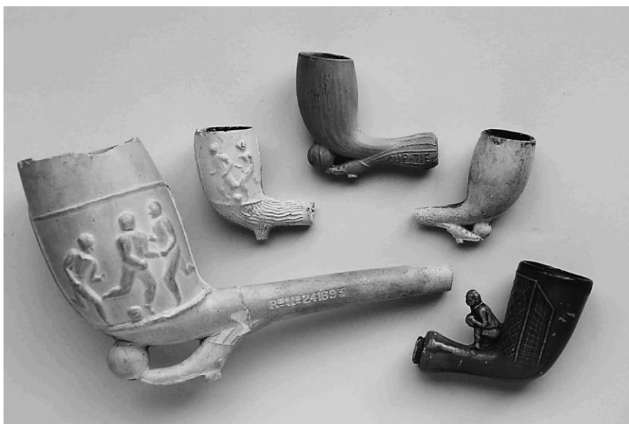
Afb. 3. Gekaste pijpen uit Engeland, ca 1880-1920. Een 'Cup-tie' pijp zoals midden boven is ook door Goedewaagen in Gouda gemaakt. De pijp met de doelman rechtsonder is van Goedewaagen, ca 1920-1940.

Anders was dit in Engeland waar enerzijds het voetbal al iets eerder vrij populair en redelijk georganiseerd was, en anderzijds de laatste Engelse pijpenfabrikanten nog voornamelijk van gekaste kleipijpen leefden. Uit de laatste decennia van 1800, en de eerste van 1900 zijn diverse Engelse modellen bekend met voetballers in reliëf op de kop (afb. 3).